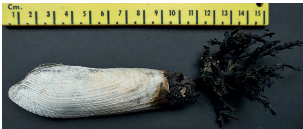
Figuur 5. Pholade.

Henk Witte was op het Hondsbosschestrand op 07-11 en meldde 2x grote zwaardschede Ensis magnus en 2x klein tafelmesheft Ensis minor . In gruis vond hij o.a. nog 1x gestreept priemhorentje Pyrgiscus crenatus , 3x scheve kokkel Parvicardium exiguum en 2x kleine platschelp Asbjornsenia pygmaea . In een kleine hoeveelheid gruis dat ik op 02-01 verzamelde bij Bergen aan Zee, zaten een paar leuke soorten zoals 1x slank gordelhorentje Onoba aculeus , 30x dwerg-drijfhorentje Pusillina inconspicua (waarvan 24 met een recent voorkomen), 1x gewone papierschelp Thracia phaseolina (klein klepje) en vijf juveniele doubletten van de gemarmerde streepschelp Musculus subpictus .