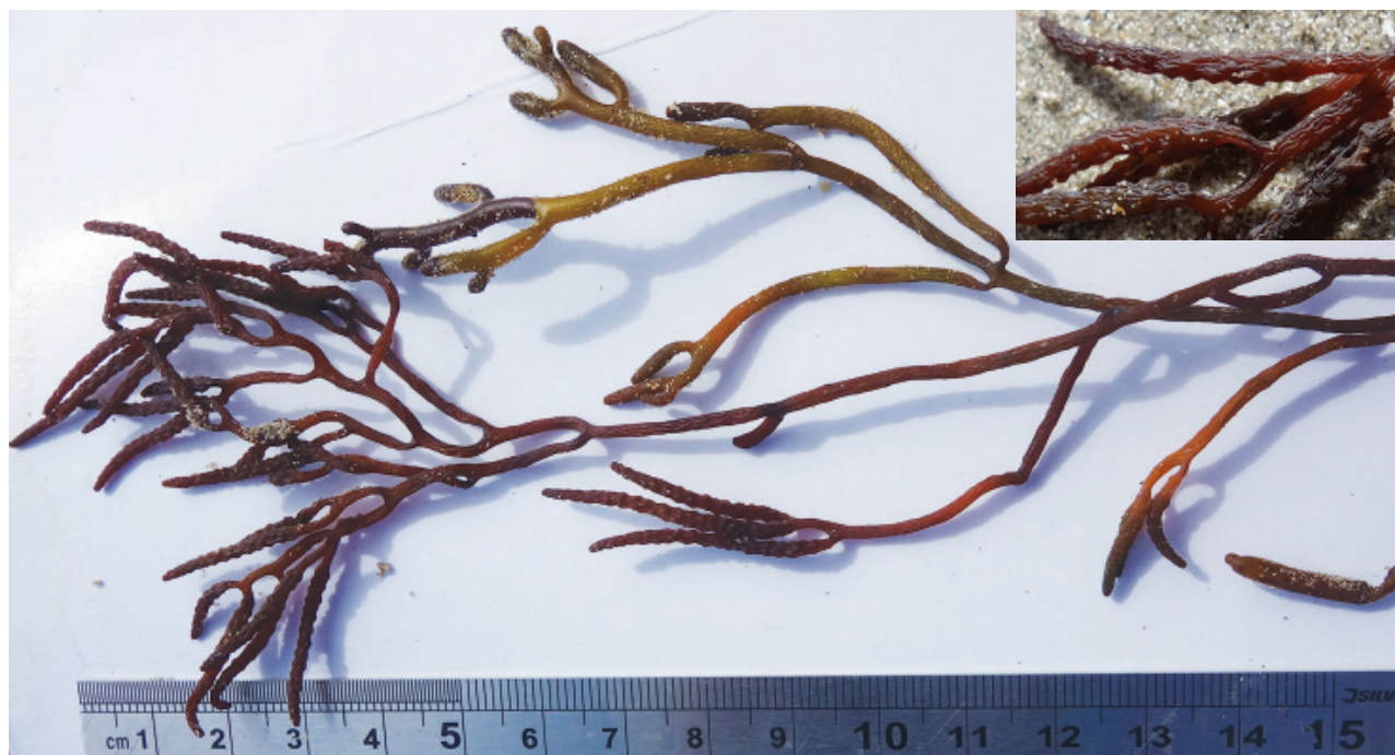
Figuur 1. Stemvorkwier. Inzet: met typische krimrimpels.