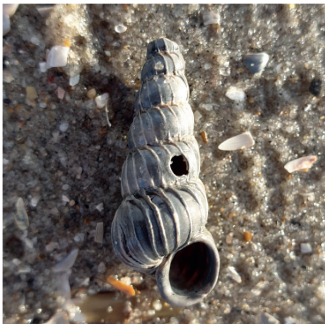
Figuur 6. Turton's wenteltrap.

1x Turton's wenteltrap Epitonium turtonis (fig. 6), 1x doublet gewone artemisschelp Dosinia exoleta (fig. 7), 1x ongevekt koffieboontje Trivia arctica , 1x pelikaansvoet Aporrhais pespelecani , 25x penhoren Turritella communis , 1x noordhoren Neptunea antiqua en een gekielde noordhoren Neptunea despecta .