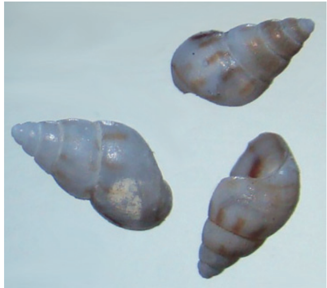
Figuur 8. klein drijfhorentje.

paar leuke dingen. Naast de bijna altijd aanwezige melkwitte arkschelpje Striarca lactea (83x, waaronder 7 doubletjes) van de tweekleppigen ook een dubbeltjesschelp Lucinella divaricata , 102x geplooid rotsboorder Saxicavella jeffreysi , 2x stippelschelpje Lepton squamosum , 6x scheef bultschelpje Altenaeum dawsoni , 2x Notolimea clandestina en 84x drietand-schelpje Epilepton clarkiae (bijna allemaal transparant wit van kleur en zelfs mogelijk twee doubletjes).