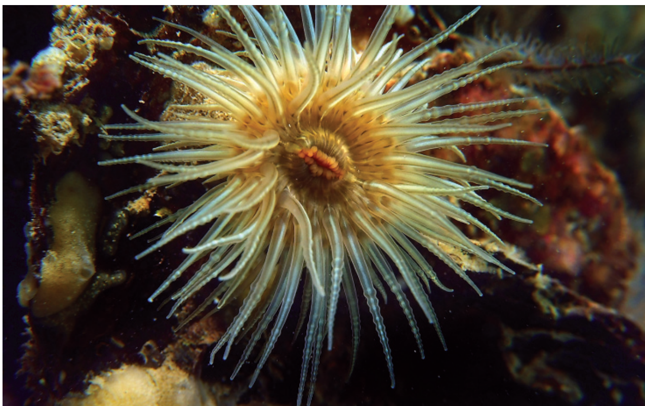
Figuur 4. Weduweroos met parelsnoerachtige tentakels t.g.v. tijdelijke samentrekkingen in de tentakels.

Arie Twigt stuurde een overzichtje van een paar strandbezoeken op het traject Katwijk-Noordwijk. Zo meldde hij van 19-10-20 een klep van de bonte mantel Mimachlamys varia en de wijde mantel Aequipecten opercularis . Op 16-11 verzamelde hij een doublet van de kleine boormossel Barnea parva , twee doubletten van de witte boormossel Barnea candida , een halve klep van een gewelfde mantel Flexopecten flexuosus , een groot topfragment van de brede strandschelp Mactra glauca en een grote klep van een paardenzadel Anomia ephippium (doorsnede 59 mm). Op 30-11 vond hij opnieuw het paardenzadel, deze keer twee kleppen, en een schaalhoren Patella vulgata . Een gave klep van een pholade Pholas dactylus vond hij op 03-12 (fig. 5).