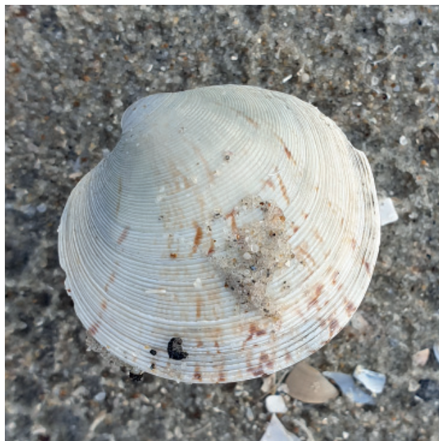
Figuur 7. Gewone artemisschelp.

Thijs de Boer meldde op 26-01 van Schiermonnikoog twee doubletten (met vleesresten) van de wijde mantel Aequipecten opercularis bij paal 15 en even verder bij paal 17 vond hij een fossiele klep van de tere hartschelp Acanthocardia paucicostata . Een paar dagen later, op 30-01, was Thijs opnieuw bij paal 15 en raapte daar een slanke noordhoren Colus gracilis op. Bij paal 16 was het weer raak, want daar lag een gave klep van de grote hartschelp Acanthocardia aculeata .