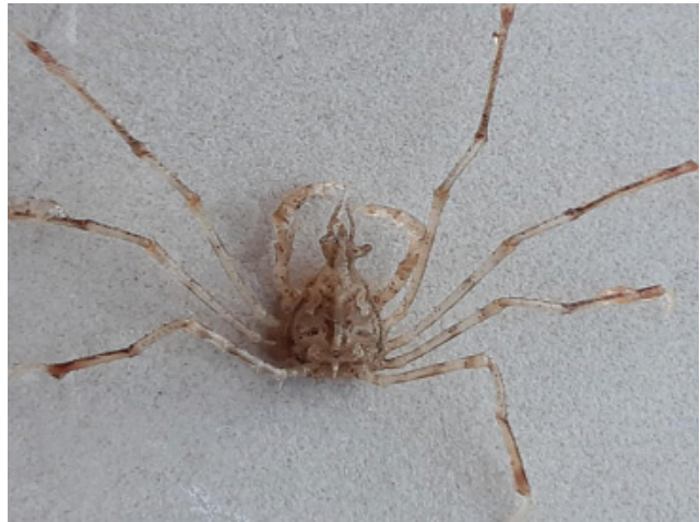
Figuur 4. Hooiwagenkrab.

Sieneke Langelaan meldde een hooiwagenkrab Macropodia rostrata op 31-12 bij Noordwijk (fig. 4). Op 03-01-21 vond de strandwacht bij IJmuiden twee exemplaren van deze soort, waarvan één levend. Ook werden er 25 exemplaren van de grijze zwemkrab Liocarcinus vernalis gevonden (1x levend, 3x dood en 21 schilden). Thijs de Boer vond van deze laatste soort ± 20 dode dieren tussen paal 5 en 6 op het strand van Schiermonnikoog op 08-01 (fig. 5).