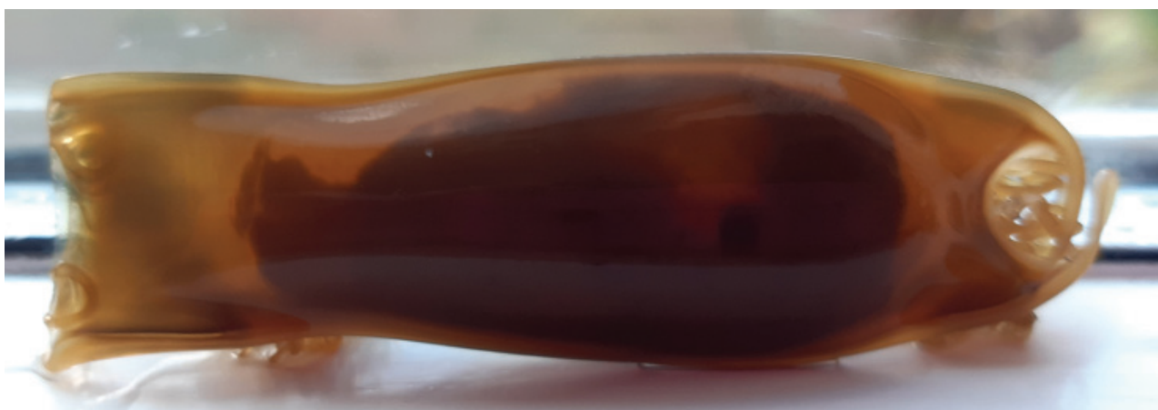
Figuur 12. Eikapsel van de Hondshaai met embryo.

Op Texel werden ook al eikapsels gevonden door Rob Dekker en Marja van den Berg. Zo vonden ze op 22-11, tussen paal 21 en 25, stekelrog Raja clavata (9x), hondshaai Scyliorhinus canicula (46x) en bij paal 23 lag een eikapsel van de golfrog Raja undulata . Op 13-12 vond Marja bij paal 13 een eikapsel van de gevlekte rog Raja montagui . Deze soort werd ook gevonden door Sieneke Langelaan op 26-12 bij Langevelderslag. En op 31-12 vond Sieneke een hondshaai eikapsel met embryo in de buurt van Noordwijk (fig. 12). Dennis Leeuw meldde van Egmond aan Zee een eikapsel van de grootoogrog Leucoraja naevus en 1x blonde rog Raja Brachyura , maar dat was al op 13-03-20.