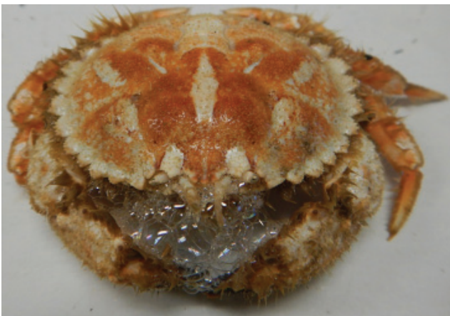
Figuur 1. Levende ovaalronde krab.

Rob Dekker meldde een hoekige krab Goneplax rhomboides bij paal 11 op het strand van Texel op 12-11. Op 03-12 meldde Rob samen met Marja van den Berg een cirkelronde krab Atelecyclus rotundatus bij paal 11 op Texel. Drie levende exemplaar van de ovaalronde krab Atelecyclus undecimdentatus werden gemeld door Loran Kleine Schaars, gevangen tijdens een monstertocht van het NIOZ op 09-12 ongeveer 15 km noordwesten van Vlieland (fig. 1). Arie Twigt meldde een schild van deze soort op 07-12 bij Katwijk (fig. 2) en ook Sytske Dijkzen vond een dood exemplaar op Texel (De Hors) op 14-12.