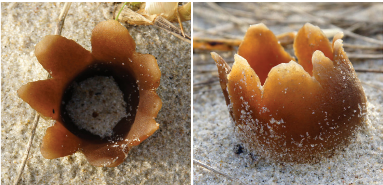
Figuur 15. Het zandtulpje op De Hors, Texel (foto: Sytske dijksen, Foto Fitis).

e-mail adres van de CS-man: rien-tien@ziggo.nl