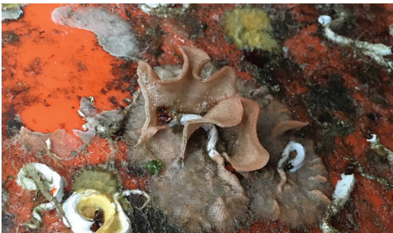
Figuur 10. Het mosdiertje Pentapora fascialis.

Op 20-11 was Rob met Marja van den Berg op het strand tussen paal 10 en 12 waar een riemwiervoetje gevonden werd met daarop Callopora lineata en Cellepora caliciformis . Twee dagen later vonden zij bij paal 22 een plastic oesternet met daarop het onverwacht mosdiertje Tricellaria inopinata . En weer twee dagen later, op 24-11, lag er bij paal 11 een stapel viskisten met daarop zes kolonies Omalosecosa ramulosa , vijf kolonies van het wimpermosdiertje Bicellariella ciliata en tien kolonies Pentapora fascialis . Ook Sabien Bosman zag deze stapel viskratten, op 26-11 tussen paal 10 en 11 op Texel, vond de Pentapora fascialis en maakte een foto (fig. 10).