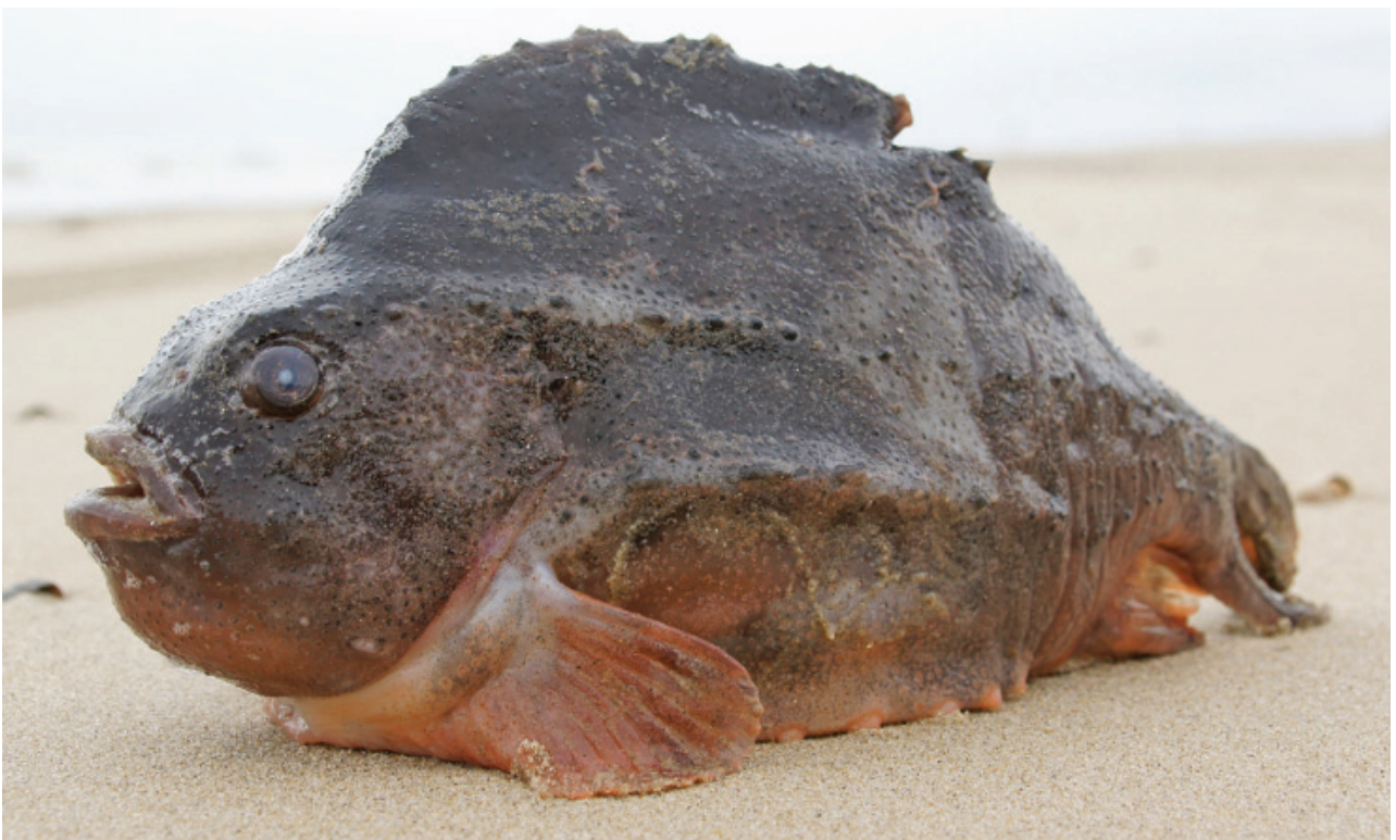
Figuur 14a. Snotolf, Paal 9 Texel.