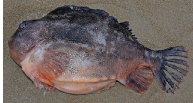
Figuur 14b. Snotolf.

Een levende maanvis Mola mola werd in de NIOZ haven gevonden door Arthur Oosterbaan op 22-12. Het dier is gevangen en overgebracht naar het aquarium van het NIOZ. Het kortsnuitzeepaardje Hippocampus hippocampus werd vier maal gemeld. Van Texel 3x: op 28-12 op De Hors door Luc Knijnsberg en Lucette Robertson (fig. 13: links), op 30-12 bij paal 11 door Rob Dekker en Marja van den Berg en op 11-01-21 door Sytske Dijkse bij paal 8 (fig. 13: rechts). Kees Peeters vond er ook één op 07-01-21 op het strand van Terschelling (fig. 13: midden). Sytske Dijkse vond op 07-01 een heel ander dier op het strand van Texel. Bij paal 9 lag een aangespoelde snotolf Cyclopterus lumpus (fig. 14a-b).