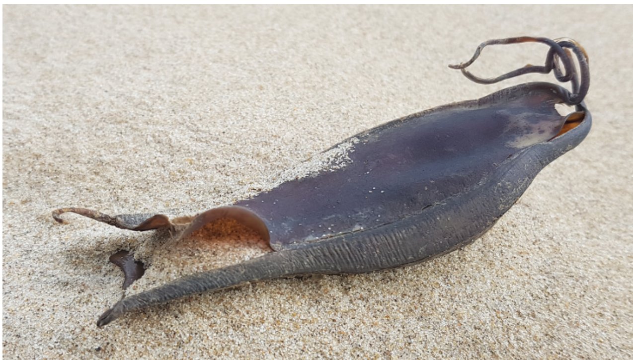
Figuur 11. Eikapsel van de Kathaai.