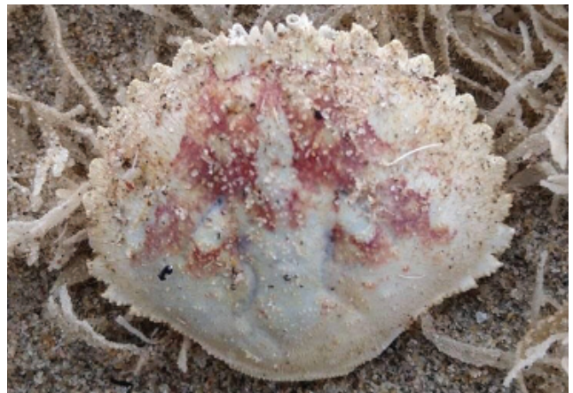
Figuur 2. Schild van een Ovaalronde krab.

Een juveniele fluwelen zwemkrab Necora puber werd door Wilbert Kerkhof gevonden op 19-12, tussen de grote hoeveelheid Electra pilosa die uit zee kwam in een garnalennet (fig. 3). Rob Dekker meldde op 26-12 ook het harig porseleinkrabbetje Porcellana platycheles . Hij vond vijf juveniele exemplaren tussen mossels Mytilus edulis bij 't Horntje op Texel. In één