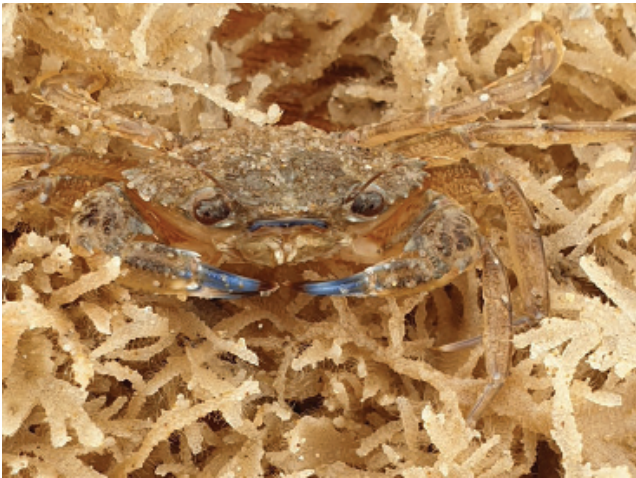
Figuur 3. Fluwelen zwemkrab tussen Electra pilosa.

van die mossels vond hij ook nog een erwttenkrabbetje Pinnotheres pisum . Ook Mick Otten vond een Pinnotheres pisum in een mossel die hij opraapte in de getijdenpoel bij Neeltje Jans op 28-12