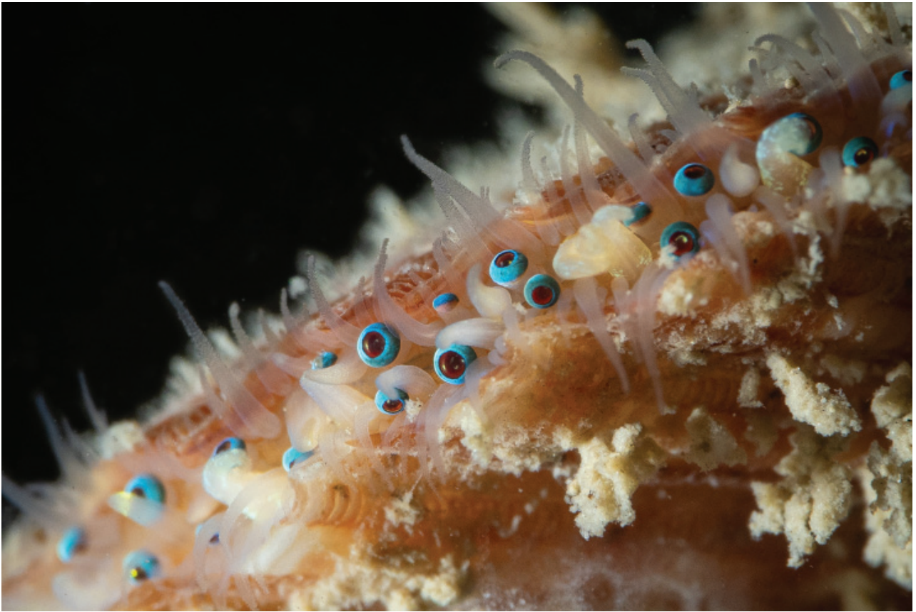
Figuur 7. Wijde mantel.

(de eerste uit die regio) is die van een levende schaalhoren Patella vulgata bij de koelwaterinlaat van de Eemscentrale op 31-10.