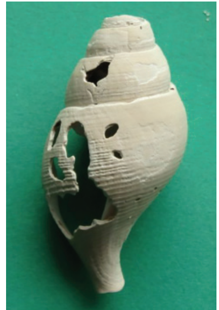
Figuur 6. Slanke noordhoren.

Ameland werd ook bezocht en op 29-09 werd er een vers doublet van de wijde mantel Aequipecten opercularis gevonden met daarop \pm 25 juveniele, levende muiltjes Crepidula fornicata . Een paar dagen later, op 04-10, was Jasper bij paal 20 in de buurt en vond daar een gaaf exemplaar van de pelikaansvoet Aporrhais pespelicani . Even verderop lag een wat beschadigd fossiel exemplaar van een slanke noordhoren Colus gracilis (fig. 6). Bas van der Sanden zag op 29-11, tijdens een duik bij de Zeelandbrug, ook een wijde mantel A. opercularis en maakte een mooie foto (fig. 7).