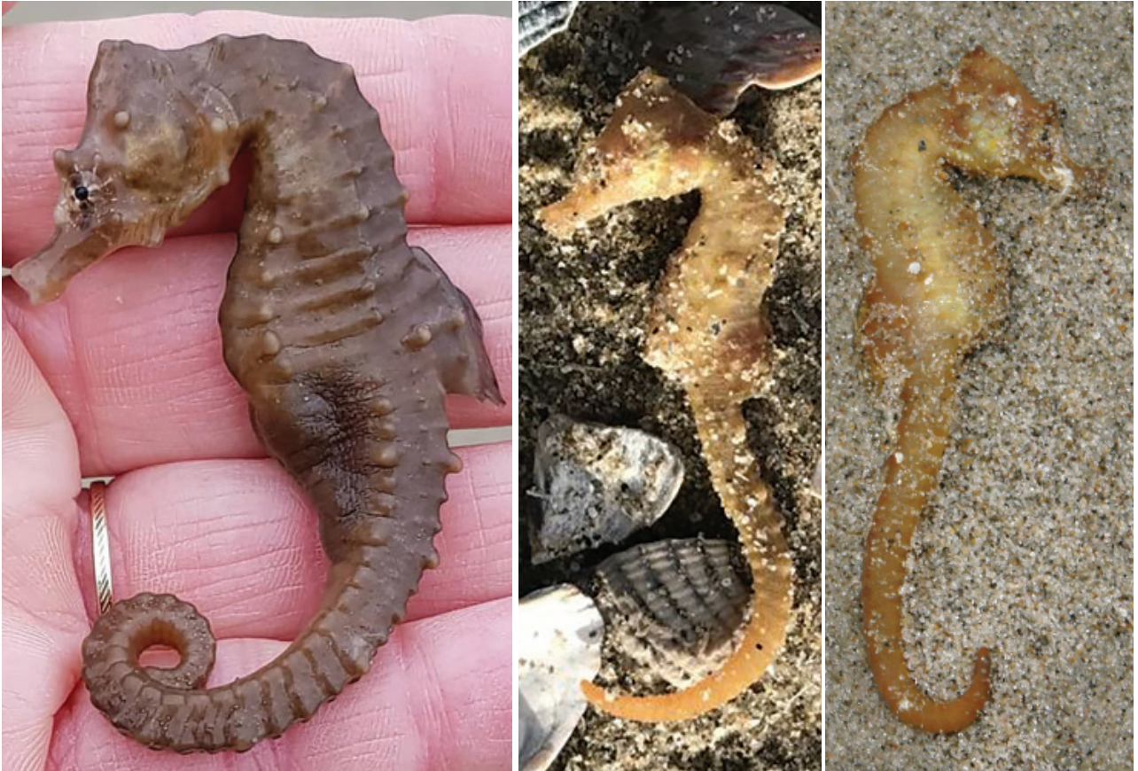
Figuur 13. Kortsnuitzeepaardje.