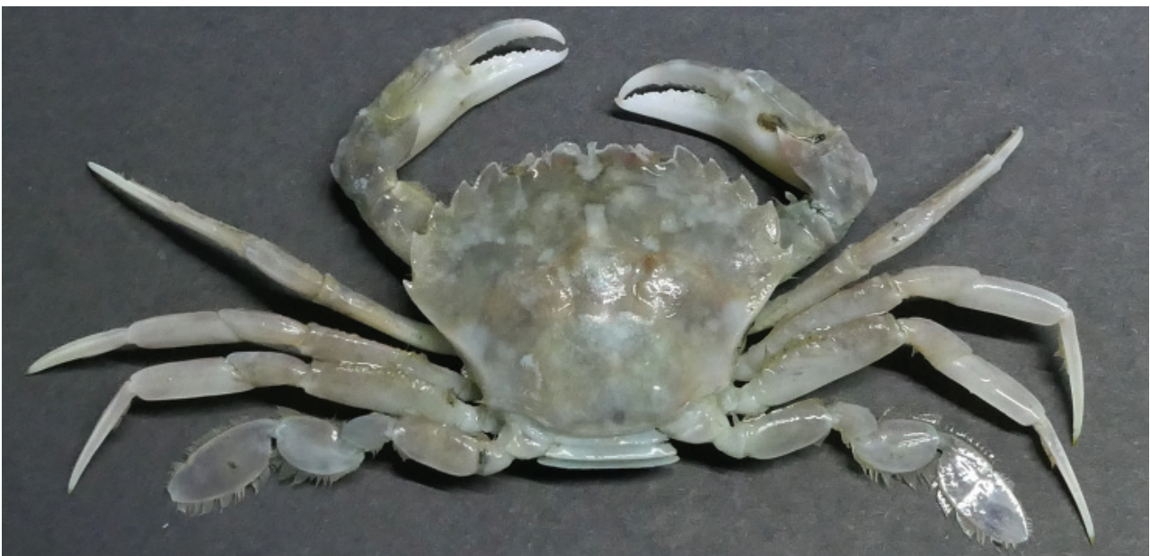
Figuur 5. Grijze zwemkrab.

Sieneke Langelaan meldde een hooiwagenkrab Macropodia rostrata op 31-12 bij Noordwijk (fig. 4). Op 03-01-21 vond de strandwacht bij IJmuiden twee exemplaren van deze soort, waarvan één levend. Ook werden er 25 exemplaren van de grijze zwemkrab Liocarcinus vernalis gevonden (1x levend, 3x dood en 21 schilden). Thijs de Boer vond van deze laatste soort ± 20 dode dieren tussen paal 5 en 6 op het strand van Schiermonnikoog op 08-01 (fig. 5).