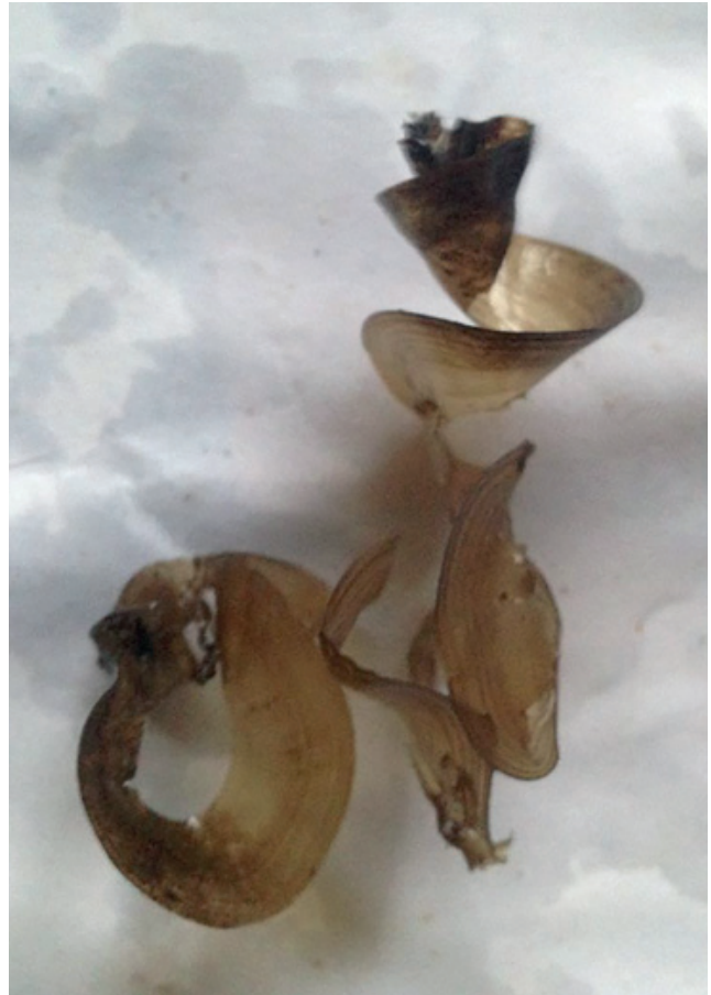
Figuur 11. Eikapsel van een stierkophaai.