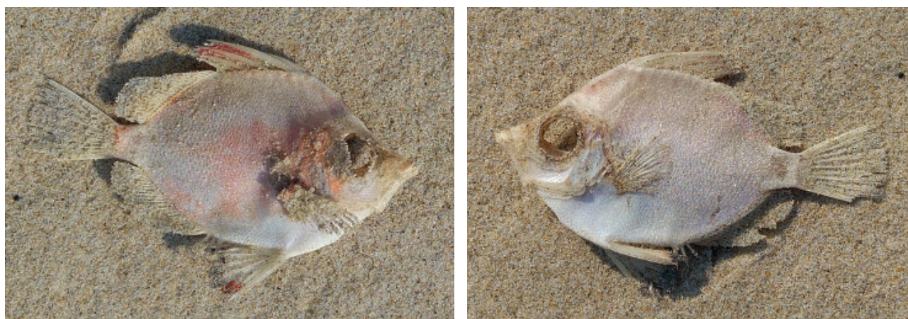
Figuur 12. Evervis van het strand bij Camperduin.

De SWG-groep regio Alkmaar was op 16-02 bij Hoek van Holland op het strand en meldde een rasterpitvis Callionymus reticulatus . Van Henk Witte kwam de bijzondere melding van een Evervis Capros aper en hij vond het visje op 08-04 bij Camperduin (fig. 12). Via Rob Dekker kwam er ook een melding binnen van de vondst van een zeepaardje Hippocampus hippocampus . Het juveniele exemplaar werd op 22-02 gevonden door E. Lindenbergh en J. van der Hoek bij paal 11 op Texel.