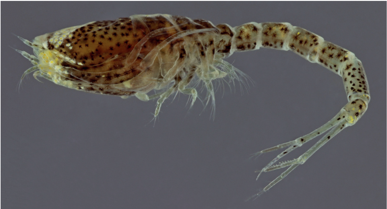
Figuur 8. De zeekomma Cumopsis goodsir.

De hoekige krab Goneplax rhomboides werd weer gevonden op Terschelling. Op 06-01 zagen Gerrit Doeksen en Kees Peeters vijf exemplaren tussen paal 14 en 19, en op 07-01 vond Gerrit er nog twee tussen paal 11 en 12.