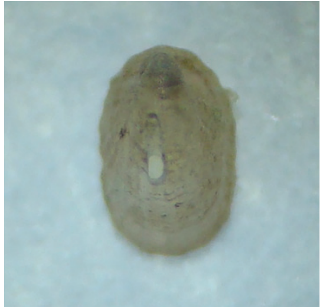
Figuur 7. Doorboorde napslak Puncturella noachina.

Op 04-05 was ik bij Camperduin op het strand en vond daar een ingang van een kreeftenfuik. Ik nam hem mee om naar mosdiertjes te zoeken, maar er zaten nog een aantal andere leuke dingen op. Om te beginnen zeven juveniele doubletten van de bonte mantel Mimachlamys varia . Verder vond ik 3x muiltje Crepidula fornicata (heel juveniel) en 7x gemarmerde streepschelp Modiolarca subpicta (één klepje en 6x juv. doublet). Maar de leukste vondsten waren die van een gestreept traliedrijfhoentje Crisilla semistriata en een juveniele doorboorde napslak Puncturella noachina (fig. 7). Op het strand zelf vond ik o.a. 2x prismatische dunschaal Abra prismatica en 11x kleine zwaardschede Ensis ensis , waarvan twee verse doubletten.