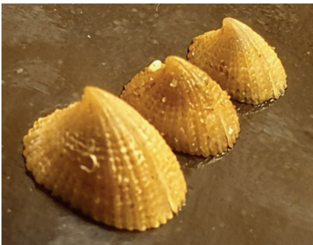
Figuur 5. Geruite napslak.

Op 03-03 maakte Wilbert Kerkhof een wandeling op 'De Hors' en vond een viskrat met een zuidelijke herkomst (Boulogne-sur-Mer). Hierop zaten o.a. een paar schilferige dekschelpen Heteranomia squamula en drie exemplaren van de geruite napslak Emarginula fissura (fig. 5). Ook vond Wilbert een emmer met daarop twee levende bonte mantels Mimachlamys varia . Op 06-03 was Wilbert bij Zandvoort op het strand