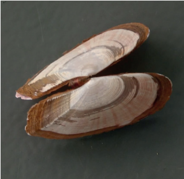
Figuur 6. Geplooiide zonnescHELP.

Yvonne Koning deed ook een mooie vondst tijdens een strandwacht tussen Camperduin en Hargen aan Zee, op 20-03. Ze raapte een mooi doublet op van de geplooiide zonnescHELP Gari fervensis (fig. 6). Gerrit Doeksen was op 03-04 op een strandje bij Harlingen, en raapte daar 56 exemplaren (kleppen en doubletten) op van de Amerikaanse strandschelp Mulinia lateralis .