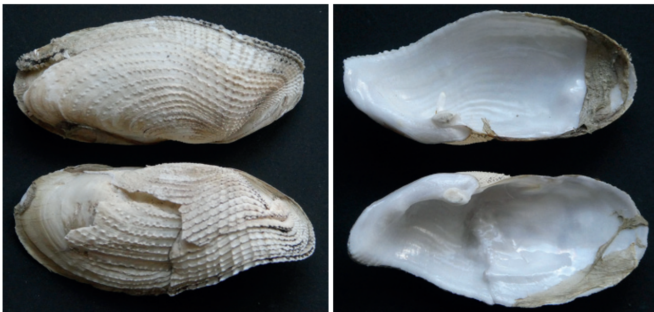
Figuur 2. Kleine boormossel met herstelde beschadiging.

en op 17-02 tussen Wijk aan Zee en Egmond aan Zee een doublet. Die dag raapt hij ook een doublet van een klein tafelmesheft Ensis minor op. Als hij op 25-02 opnieuw bij Den Helder is, vindt hij weer een klep van Ensis magnus , samen met een klep van een groot tafelmesheft Ensis siliqua . Als Wilbert op 07-02 bij Wijk aan Zee op het strand is om te kijken wat er na een paar dagen stormachtig weer op het strand ligt, vindt hij naast ruim 1000 levende witte dunschalen Abra alba ook een flink aantal levende grote strandschelpen Mactra stultorum (met uitgestoken siphon) en enkele levende grote tepel-