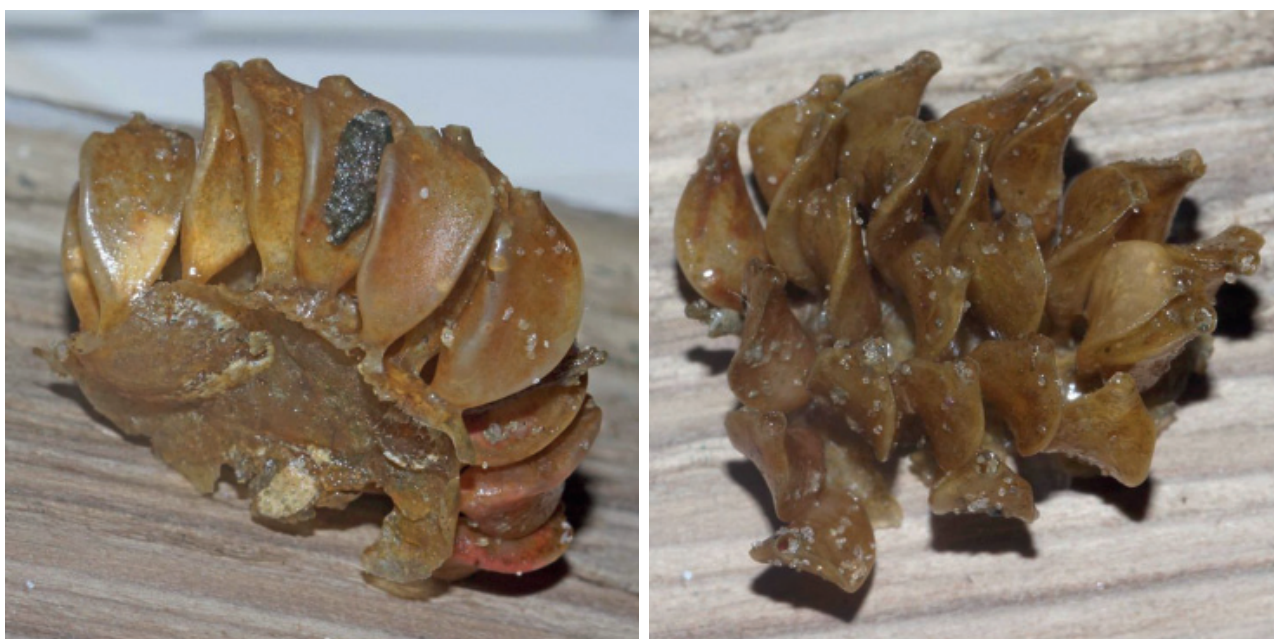
Figuur 3. Eieren van de Japanse stekelhoren.

en op 17-02 tussen Wijk aan Zee en Egmond aan Zee een doublet. Die dag raapt hij ook een doublet van een klein tafelmesheft Ensis minor op. Als hij op 25-02 opnieuw bij Den Helder is, vindt hij weer een klep van Ensis magnus , samen met een klep van een groot tafelmesheft Ensis siliqua . Als Wilbert op 07-02 bij Wijk aan Zee op het strand is om te kijken wat er na een paar dagen stormachtig weer op het strand ligt, vindt hij naast ruim 1000 levende witte dunschalen Abra alba ook een flink aantal levende grote strandschelpen Mactra stultorum (met uitgestoken siphon) en enkele levende grote tepel-