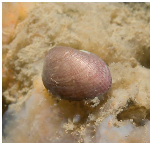
Figuur 2. Gemarmerde streepschelp.

Van Wilbert Kerkhof kreeg ik een lijstje met vondsten die hij verzamelde in januari en februari van dit jaar. Op 16-01 vond hij bij Den Helder een prismatische dunschaal Abra prismatica en drie kleppen van de grote zwaardschede Ensis magnus . Van deze laatste soort vond hij op 26-01 ook een klep bij Petten,