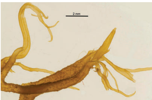
Figuur 1. Franjewier, Cutleria multifida , boven gehele plant; links: detail toppen van de takken.