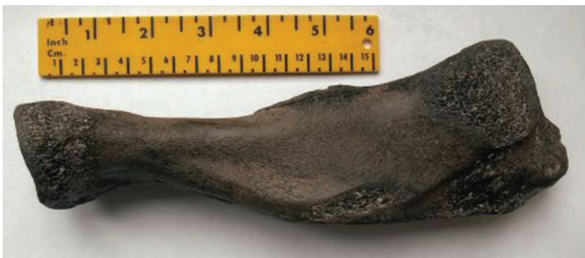
Figuur 13. Bot van een walrus Odobenus rosmarus.

15 en 17 lagen er 33x R. clavata , 2x gevlekte rog Raja montagui en 5x S. canicula . Tussen paal 10 en 12 op 03-02 waren het 45x R. clavata , 1x blonde rog Raja brachyura en 9x S. canicula . Ikzelf vond op 27-02 tussen Bergen aan Zee en Schoorl 14x S. canicula , 23x R. clavata , 1x R. montagui en 1x golfrog Raja undulata . Wilbert Kerkhof was een paar dagen later (04-03) ook op dat stuk strand en verzamelde toen 25x R. clavata , 3x R. montagui en 1x kleinoogrog Raja microocellata .