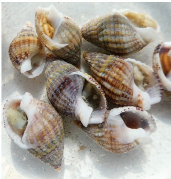
Figuur 10. Levende gevlochten fuikhorens Tritia (Nassarius) reticulatus.

Op de site van Schelpenmuseum 'Paal 14' stonden ook weer een paar leuke waarnemingen. Zo werd er door Bea Cohen op 13-03 bij paal 4 een klep gevonden van een ovaal nonnetje Macoma calcarea . Op 06-04-18 deed Thijs de Boer een hele bijzondere vondst op de Balg, namelijk een Groenlandse kokkel Serripes groenlandicus (fig. 11). Het is de eerste vondst van deze soort op de Waddeneilanden. Op 16-04-18 vond Thijs bij paal 12 een doublet van de gevlamde tapijtschelp Tapes rhomboides , en ook dit is iets dat niet vaak gevonden wordt. Jasper Schaaf verzamelde op Schiermonnikoog een fossiele klep van een paardenzadel Anomia ephippium op 03-05.