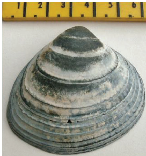
Figuur 11. Groenlandse kokkel Serripes groenlandicus.

Janny Nijman nam op 13-04 wat gruis mee van het strand bij Camperduin en vond daarin o.a. 3x gestreept priemhorentje Turbonilla rufa , 1x dubbeltjesschelp Lucinella divaricata , 1x geribd zeeklitschelpje Montacuta substriata en een prismatische dunschaal Abra prismatica .