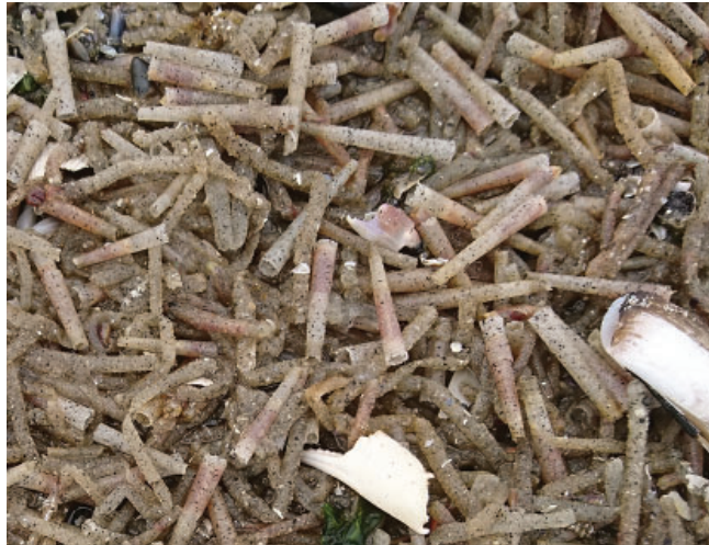
Figuur 4. Goudkammetjes Lagis koreni.