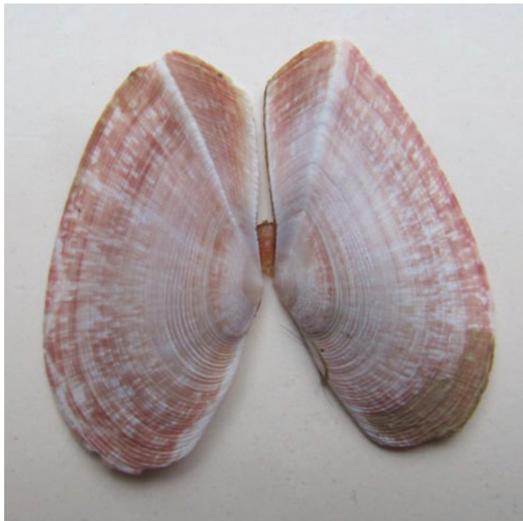
Figuur 7. Geplooides zonnenschelp Gari fervensis.

Op 18-02 werd tijdens de strandwacht Texel een doublet van de geplooides zonnenschelp Gari fervensis gevonden en op 04-03 ook twee doubletten. Op 08-04 rapen Rob en Marja nog eens vier doubletten van deze soort op met als opmerking er bij dat dit een gevolg is van de suppletie die daar eerder is uitgevoerd (fig. 7).