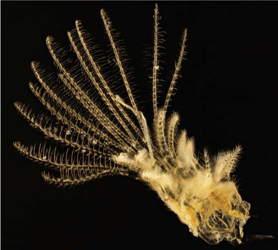
Figuur 12. Vervelling van een zeepok.

Deze laatste soort zat ook aan de binnenkant van een zwarte plastic buis samen met kolonies van Escharella variolosa , Escharoides coccinea , Chorizopora brongniartii , Amphiblestrum auritum en Diplosolen obelia . Ook zaten er tientallen jonge kolonies van Microporella ciliata in, van vaak niet meer dan een paar zoïden waarvan de ancestrula (eerste zoïde van een kolonie, gevormd uit een vrij zwemmende larve) duidelijk te zien waren.