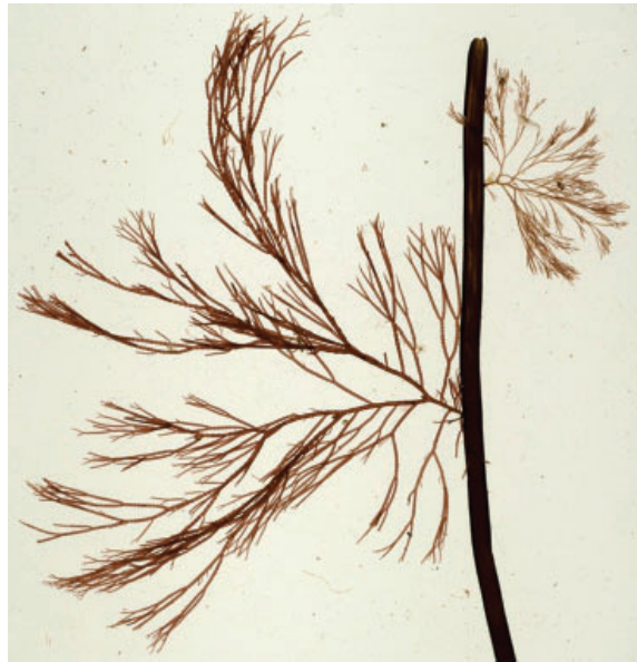
Figuur 3 (boven). Rood horentjeswier, Ceranium virgatum (links) en Struikbuiswier, Polysiphonia harveyi (rechts) op riemwier, Himanthalia elongata.