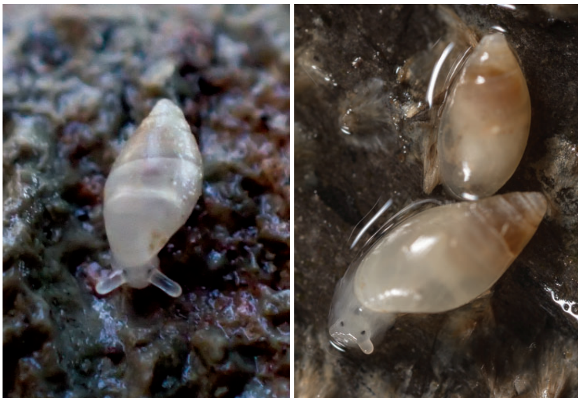
Figuur 5. Wit muizenootje, Auriculina bidentata.