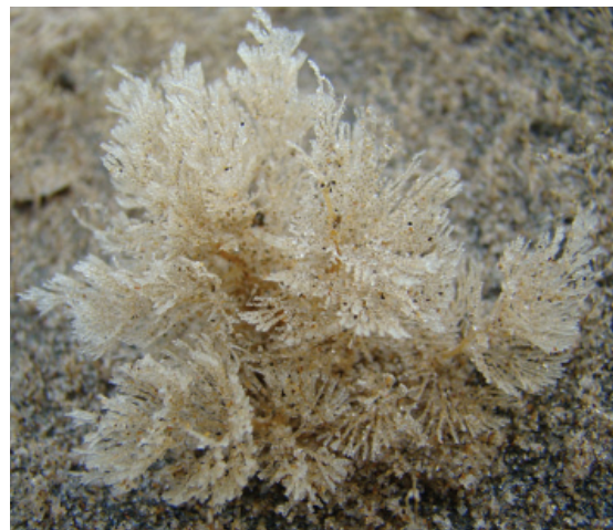
Figuur 8. Spiraalmosdiertje Bugula plumosa.

Een onderdeel van een kreeftenfuik dat ik vond op 05-11 bij Egmond aan Zee bleek begroeid met maar liefst 35 soorten mosdiertjes. Een paar van de minder vaak gevonden soorten zijn geitenhoornmosdiertje Crisidia cornuta , Plagioecia sarniensis , Cauloramphus spinifer , Puellina innominata , Figularia figularis , Escharoides coccinea , Schizomavella cuspidata , Rhynchozoon bispinosum , Escharella labiosa , breedbladig mosdiertje Flustra foliacea (maar dan vlakke eerstejaars kolonies), Tubulipora lobifera , Phaeostachys spinifera en Membraniporella nitida . Deze laatste soort zat ook op een stuk plastic dat ik op 19-12 vond bij Egmond. Een paar andere soorten (er zaten er 23 op) van dit plastic zijn o.a. Celleporina caliciformis , Eurystrotos compacta , Cryptosula pallasiana en een mooi struikje spiraalmosdiertje Bugula plumosa (fig. 8). Aan de binnenkant van een klein plastic flesje zaten nog een paar mooie kolonies Fenestrulina delicia .