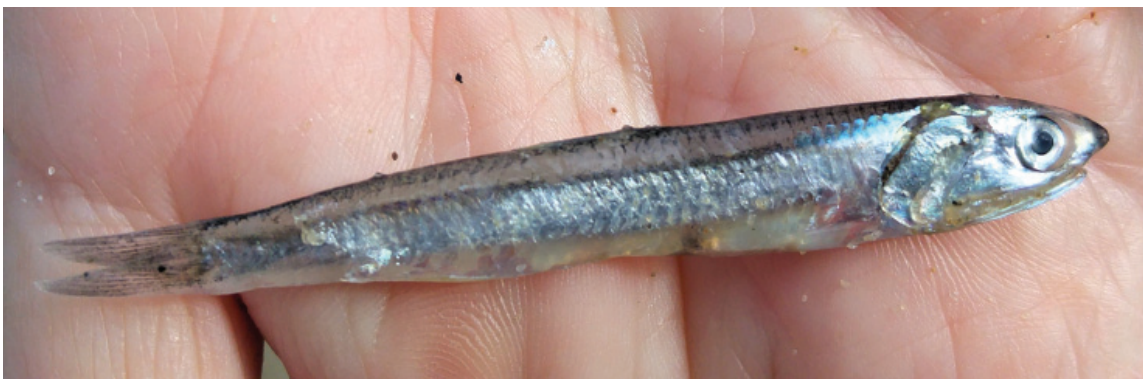
Figuur 10. Ansjovis Engraulis encrasicolus.