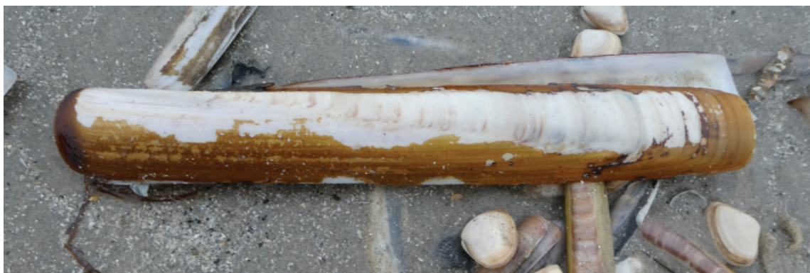
Figuur 5. Groot tafelmesheft Ensis siliqua.

Tussen de byssusdraden van mossels Mytilus edulis , die aan een steigerpaal bij het Horntje zaten, vond Rob op 31-10 wel 65 exemplaren van het mosselslurpertje Odostomia scalaris , en op 22-11 vond hij twee purperslakken Nucella lapillus onder stenen onderaan de dijk bij het Horntje.