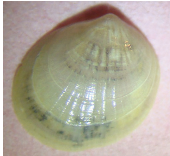
Figuur 7. Geribd zeeklitschelpje Montacuta substriata (foto: Rien de Ruijter).

Een beetje gruis dat ik verzamelde op 19-12 bij Egmond aan Zee leverde een leuke waarneming op, want naast o.a. een flink aantal losse klepjes en doubletjes van het tweetandschelpje Kurtiella bidentata en klepjes van het ovale zeeklitschelpje Tellimya ferruginosa zat er ook een klepje tussen van een geribd zeeklitschelpje Montacuta substriata (fig. 7).