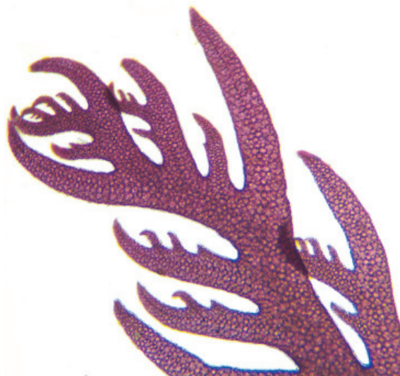
Figuur 1. Kamwier Plocamium cartilagineum , St Margarets Bay, UK.

Bij Egmond aan Zee lag er op 05-11 ook veel wier op het strand. Het waren fragmenten van blaaswier Fucus vesiculosus , knotswier Ascophyllum nodosum , Japans bessenwier Sargassum muticum , hauwwier Halidrys siliquosa en veterwier Chorda filum . En op deze laatste soort zaten veel andere wiertjes zoals rood horentjeswier Ceramium virgatum , Ceramium pallidum , struikbuiswier Neosiphonia harveyi , Antithamnionella ternifolia , Falkenbergia rufolanosa , Sphacelaria spec., breed darmwier Ulva linza en Hincksia granulosa . Deze laatste soort vond ik ook op 26-11 bij Camperduin op een plastic bakje, samen met Hincksia mitchelliae ,