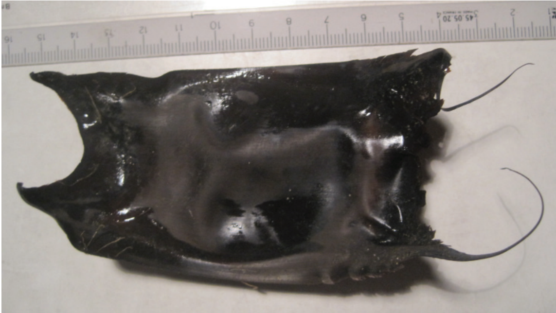
Figuur 11. Kleinoogrog Raja microocellata.

van Egmond. Het waren er twee en lagen op het strand tussen Katwijk en Noordwijk. Op dat zelfde stuk strand vond Jaap op 15-11 een eikapsel van de kleinoogrog Raja microocellata (fig. 11). Ook Gerhard Cadée vond een eikapsel van Raja microocellata : op 26-11 op Texel tussen paal 15 en 16. Tijdens de strandwacht bij IJmuiden op 19-11 werden er ook eikapsels gevonden en wel 1x stekelrog Raja clavata , 1x gevlekte rog Raja montagui en 8x hondshaai Scyliorhinus canicula .