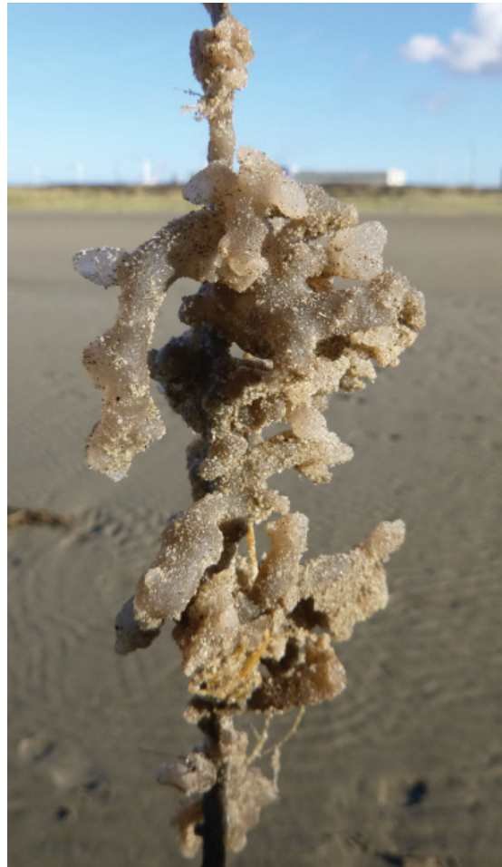
Figuur 9. Grijze zeevinger Alcyonidium condylocinereum.

De SWG-groep regio Alkmaar was op 10-09 op het Banjaardstrand en vond daar naast heel veel schelpen ook een paar visjes. Het waren juveniele exemplaren van de sprot Sprattus sprattus , haring Clupea harengus , sardien Sardina pilchardus en ansjovis Engraulis encrasicolus (fig. 10).