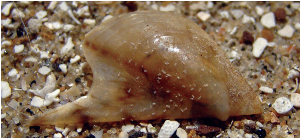
Figuur 4. Vleugeloester Pteria hirundo , 31-7-93.

We beginnen met een paar oude meldingen. Onlangs kreeg ik van Trudy Kühne een paar doosjes met schelpen, die kwamen uit de verzameling van Rineke Gronert. Helaas zaten er niet bij alle monsters gegevens met de datum en vindplaats, maar in de doosjes waarbij dat wel het geval was, zaten een paar leuke dingen. Op 10-09-90 werd er op een jerrycan een doublet van de groene dekschelp Monia squama gevonden op het strand van Petten. Op 30-08-93 werd deze soort ook gevonden op een plastic kistje bij de Hondsbossche zee-wering en op 27-03-95 op een kreeftenfuik bij Petten. Op 31-07-93 lag er op het strand bij Petten ook een jerrycan waarop niet alleen 25 doubletten van de schilferige dekschelp Heteranomia squamula en 2 doubletjes van de wijde mantel Aequipecten opercularis zaten, maar ook een doublet van een vleugel-oester Pteria hirundo (fig. 4). In een ander doosje zaten 41 klepjes (en één