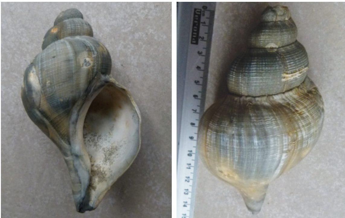
Figuur 6. Noordhoren Neptunea antiqua.

Arie Twigt vond op 16-11 een plastic kratje op het strand tussen Katwijk en Noordwijk met daarop drie doubletjes van de bonte mantel Mimachlamys varia en een doublet van de noordse rotsboorder Hiatella arctica . Op 25-11 lag er op dat strand een doublet van de Filipijnse tapijtschelp Ruditapes philippinarium . Een wat oudere waarneming die Arie doorgaf was die van een beschadigd exemplaar van de geknobbelde tolhoren Gibbula magus , gevonden op 11-04 bij Katwijk. Een soort die slechts 1x in het CS voorkomt van de locatie 'Kwade Hoek' op Goeree, is de noordhoren Neptunea antiqua . Katie van der Wende vond er één op 01-12 bij paal 6 (fig. 6).