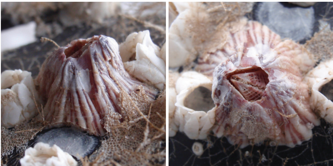
Figuur 3. Balanus trigonus (foto's: Kees Peeters).

Een Megabalanus coccopoma werd gevonden door Harald de Haan op 17-02 in Den Helder op een kabelboei. Ikzelf vond op 19-12 een aantal exemplaren van de Afrikaanse zeepok Solidobalanus fallax op een stuk plastic bij Egmond